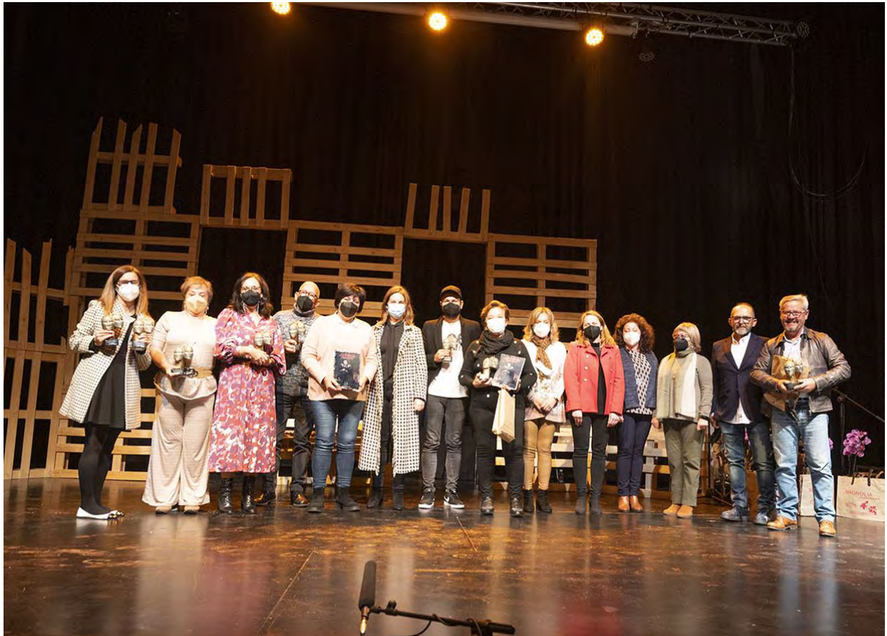
Premiados en el Certamen de Teatro no Profesional / KARPINT