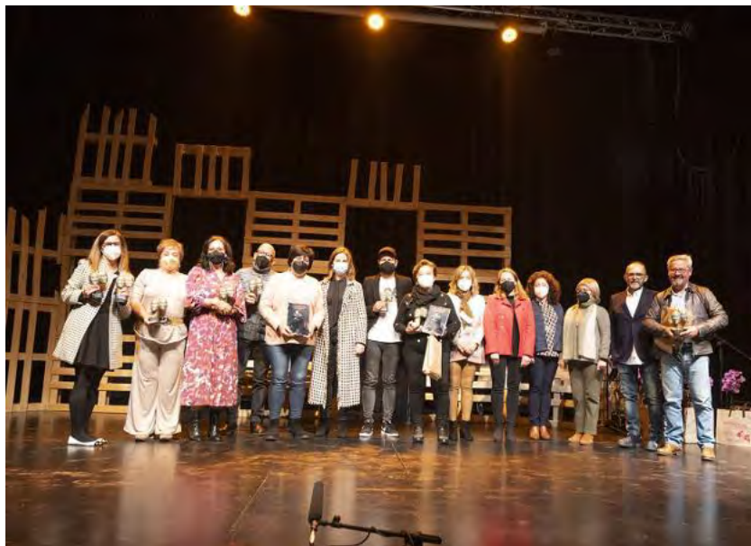
Foto de familia de los premiados.