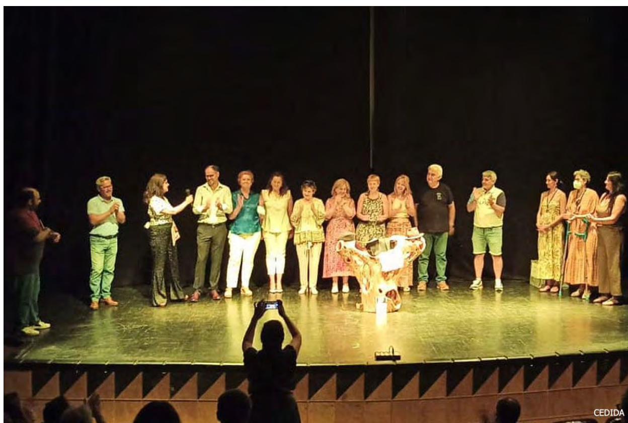
Foto de familia de los premiados en el I Festival de Teatro Nacional Amateur en Guareña /.