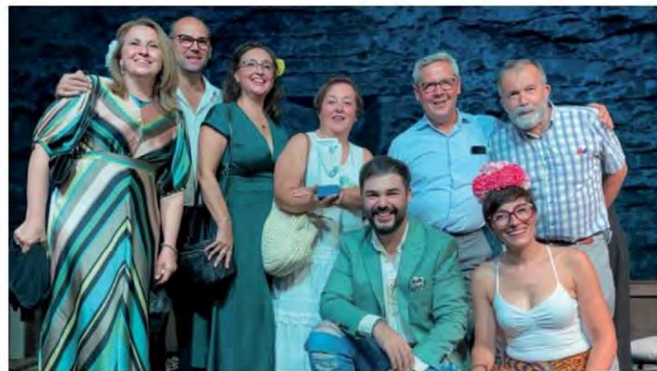
En los premios Talavera MEIM 2021