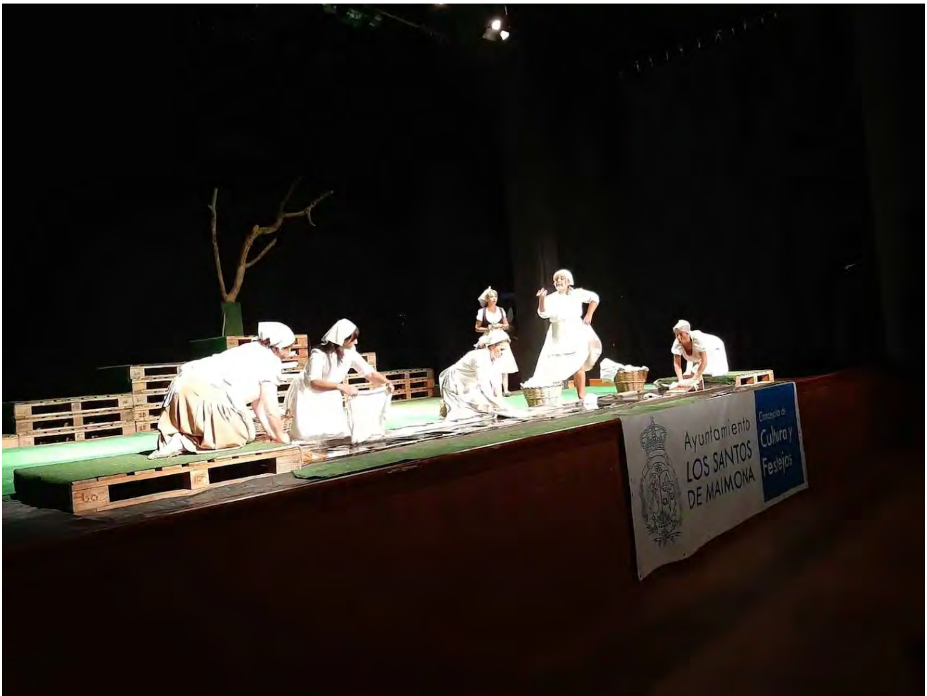
El coro de las lavanderas Lucio Poves