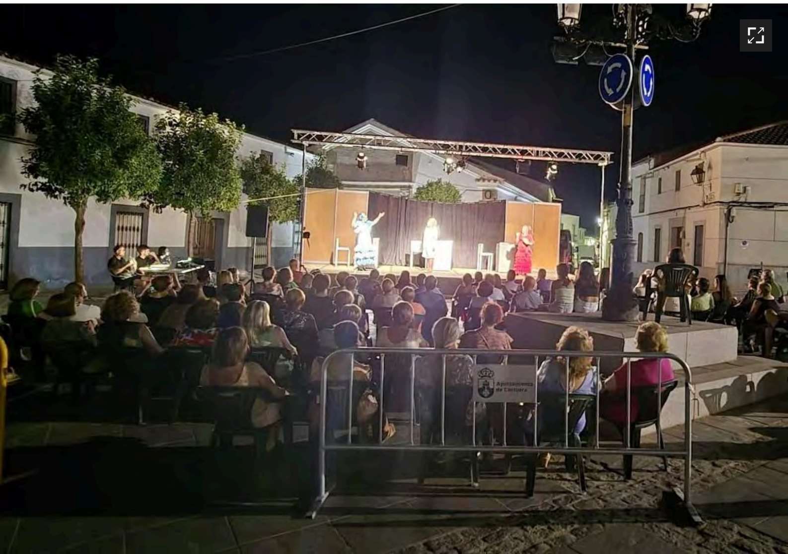
Imagen de la representación en la Plaza de San Juan.

Esta representación se enmarca dentro del programa de actividades culturales, deportivas y de ocio y diversión que ha organizado el Ayuntamiento para los meses verano.