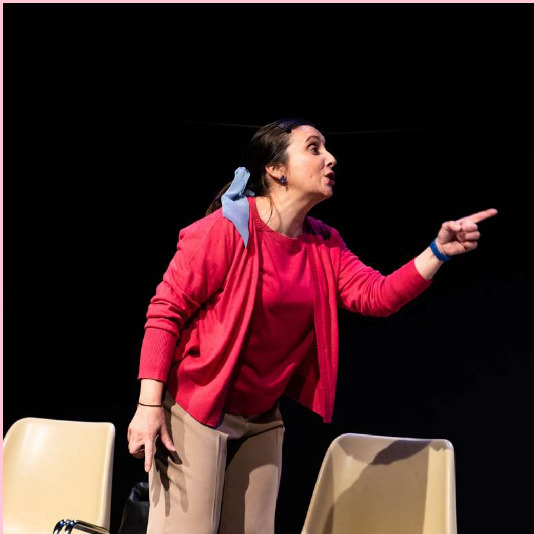
MARU DUARTE (MARTIRIO)