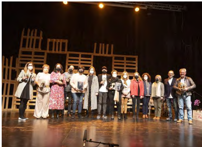
Foto de familia de los premiados.