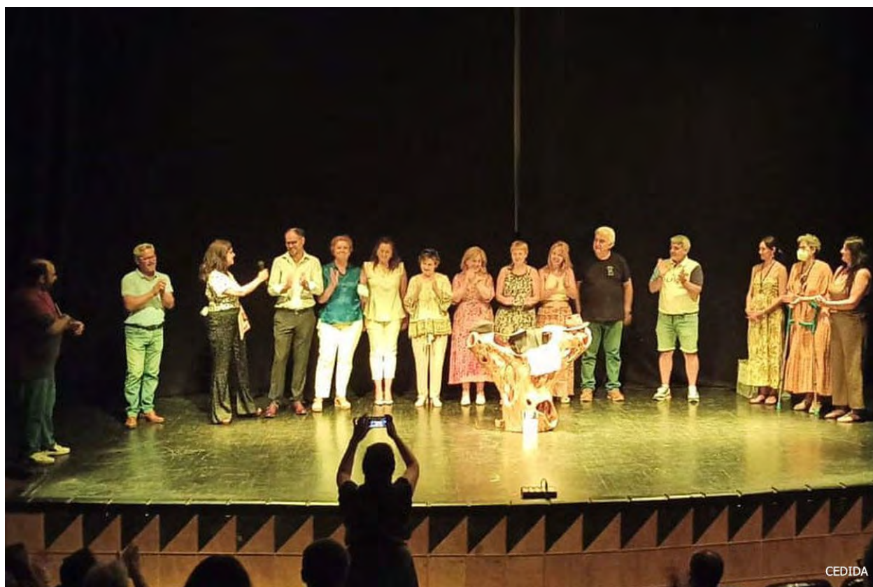
Foto de familia de los premiados en el I Festival de Teatro Nacional Amateur en Guareña