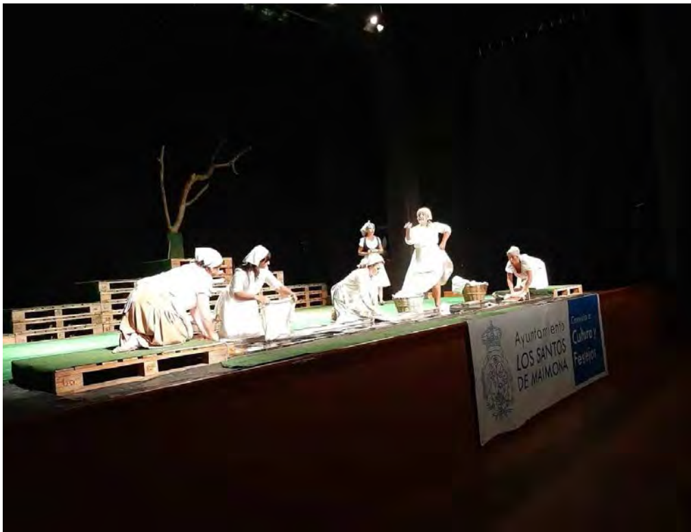
El coro de las lavanderas Lucio Poves

El resto del elenco, en papeles menores pero igual de relevantes para la comprensión de la tragedia, sigue también a rajatabla el texto del poeta en una España rural de los años treinta.